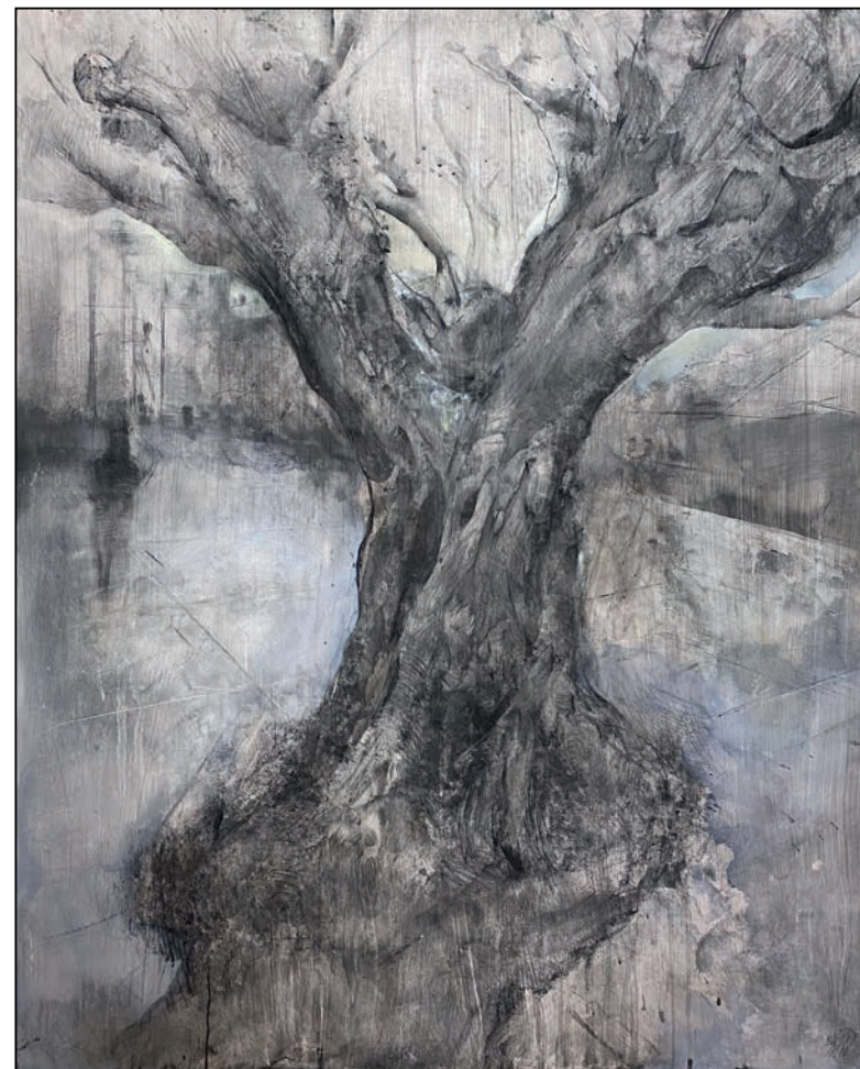
Paisaje Intervenido Miguel Nieto Simón

Soporte: Lienzo - Técnica: Acuarela - Dimensiones: 100x81 cm