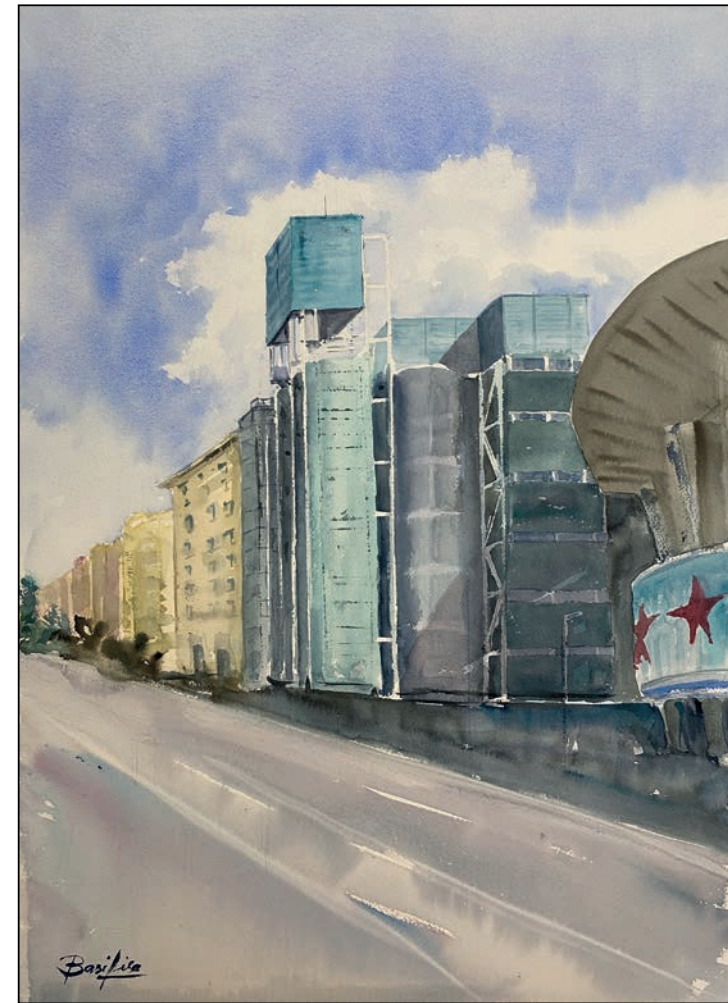
Metrópolis Basilia Gómez Mateos

Soporte: Lienzo - Técnica: Óleo - Dimensiones: 60x40 cm