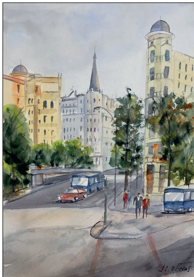
Alcalá con Goya frente a la casa del Libro