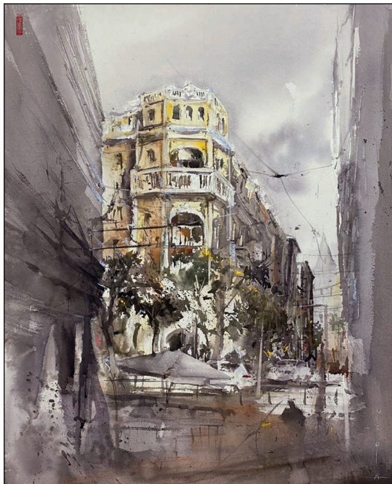
Luz, después de la lluvia Miguel Ángel Medina Plaza “Vega”

Soporte: Lienzo - Técnica: Acuarela - Dimensiones: 100x81 cm