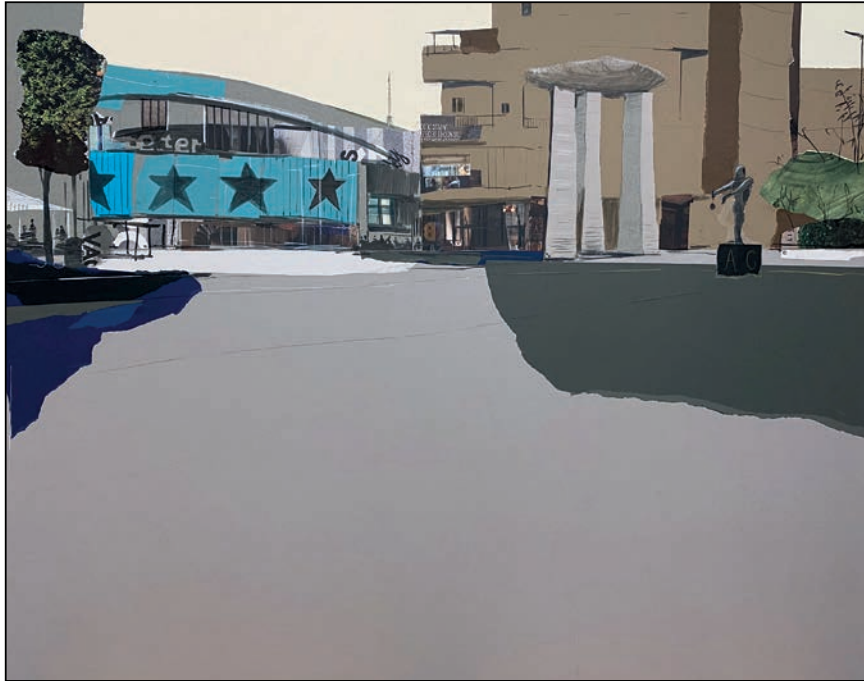
Espacios de la plaza de Dalí Eduardo Gómez Query

Soporte: Madera - Técnica: Collage acrílico y grafito - Dimensiones: 80x99 cm