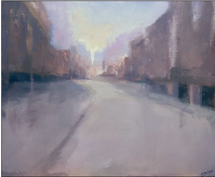
Plaza de Dalí Antonio Marina

Soporte: Tabla - Técnica: Acrílico - Dimensiones: 81x100 cm