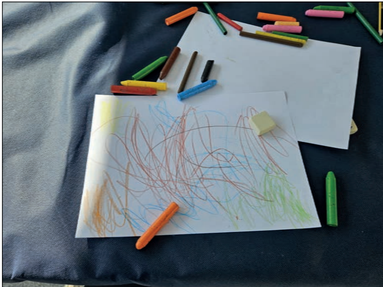
Talleres infantiles en la mañana del certamen.