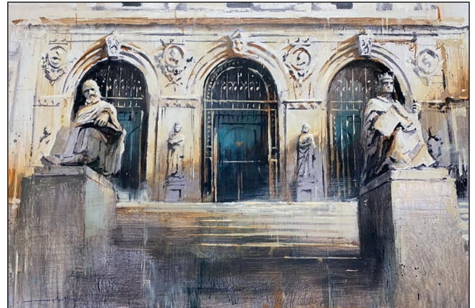
Biblioteca Nacional Javier Martín Aranda

Soporte: Madera - Técnica: Collage acrílico y grafito - Dimensiones: 80x99 cm