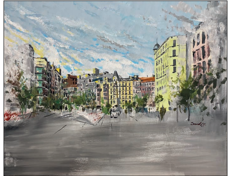
Apunte de arquitectura Imanol Cilla Intxaurreaga

Soporte: Madera - Técnica: Mixta - Dimensiones: 100x81 cm